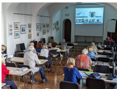
Na enem od srečanj animatorjev