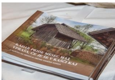
Naslovnica monografije o kaščah