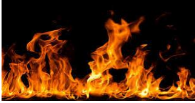
Element ogenj.