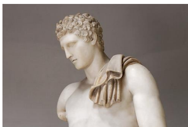
Hermes - zaščitnik športa.

Publikacije so dosegljive v tiskani obliki in na spletu. Študenti UTŽO, še posebej študenti v arhitekturnem programu mentorice Mete Kutin, so veliko prispevali k uspešnemu zaključku projekta, saj je njihov program dela nastajal tudi pod vplivom projekta in pričakovani partnerskih organizacij, Društva arhitektov Ljubljane ter ob sodelovanju revije Outsider. V projektu so s svojimi mnenji sodelovali tudi študenti angleškega jezika UTŽO Ljubljana. Več: https://www.dreamlike-neighbourhood.eu/wp-content/uploads/2022/11/221109_DLNBH_ResourceKit_slo_compressed.pdf