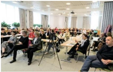
Posvet mreže SUTŽO je povezal udeležence iz vse Slovenije

Ob začetku študijskega leta smo z animatorji spregovorili o njihovi dragoceni vlogi v študijski skupini. 71 animatorjev se je odzvalo povabilu na srečanje. In kaj je njihova vloga? Animatorji so »prostovoljsko« tkivo UTŽO. Predlagajo študijske vsebine, obveščajo »sošolce in sošolke«, se pogovarjajo z vodstvom UTŽO, vzdržujejo korespondenco, opogumljajo, se tudi pritožijo v imenu skupine, obveščajo člane skupine o aktualnih dogajanjih, ki so vsebinsko povezana z izobraževalnim programom in jih motivirajo za različne zunaj učilnične dejavnosti. So mentorjeva desna roka. V veliko pomoč so zaposlenim na sedežu UTŽO, saj vodijo evidenco članov svojih skupin, obveščajo o prostih mestih v študijskih skupinah ter posredujejo prošnje in pobude članov svojih skupin mentorju/ici in zaposlenim na sedežu UTŽO. Na srečanjih smo jim predstavili tudi novo spletno aplikacijo, ki smo jo s sofinanciranjem MJU razvili v projektu Digitalna UTŽO in bo omogočala bolj učinkovito komunikacijo med animatorji in sedežem UTŽO. (Vir: Urška Telban)