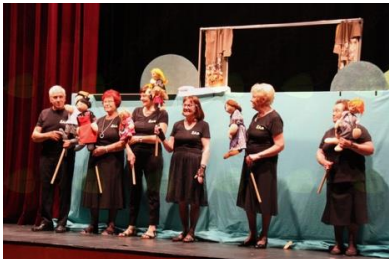
Lutkarji skupine Žar po izvedbi Pestrne

socialnem prostoru. Če smo obdani s plesalci, postanejo tudi naši gibi natančni, vzravnamo glavo in telo, če živimo v domu starejših, kaj kmalu pričnemo podrsavati, če opazujemo natararje v dobrih restavracijah, se ti gibljejo svojemu položaju primerno. Mlade asistentke na fakultetah stopajo hitro in odločno itd. Gibanja se učimo nezavedno ali zavedno. Da bilo zavedno, tega si želimo. Fedelkreisova metoda, Alexandrova tehnika, holistična kultura telesa (občutki, čustva in misli), pa tudi nekatere borilne veščine, funkcionalna analiza plesnega giba so metode somatske vzgoje. Vse metode so osredotočene na telo, da ga razumemo, da to posledično razume nas, na misleče, zavedno telo, kjer se srečujejo občutki, čustva in misli. Pa še to: predpona soma označuje povezavo telesa, psihe in razmišljanja. Program Misleče telo je za letošnje študijsko leto že zapolnjen.