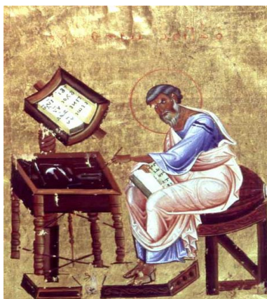
Sveti Matej piše v kodeks; pred njim je pisalno orodje pisarjev. Konstantinopol, 12. st.