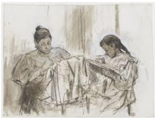
Avtor: Pablo Picasso