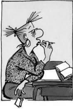
Karikaturistka Claire Bretcher in njene podobe žensk