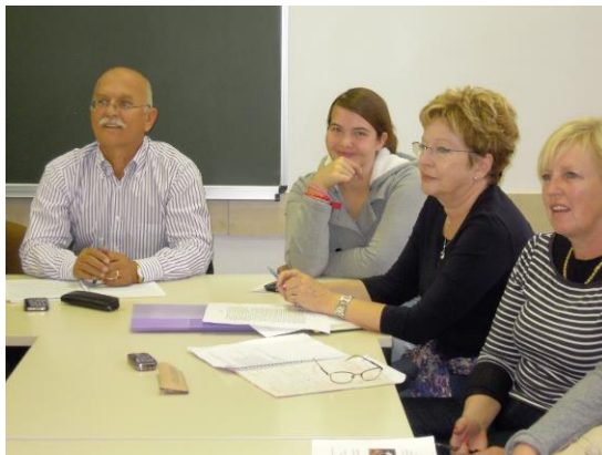
Medgeneracijsko učenje na univerzi za tretje življenjsko obdobje

Današnji čas je čas, ko nastajajo nove oblike solidarnosti navadno na natanko določenem ozemlju. Tudi druge prebivalstvene spremembe (staranje delovne sile, manjšanje obsega delovne sile, migracije) oblikujejo položaj starejših in starosti. Slovenska univerza za tretje življenjsko obdobje se je zmeraj odzivala na družbene spremembe. Ves čas pa je imela pred očmi dejavno staranje in spreminjanje položaja starejših.