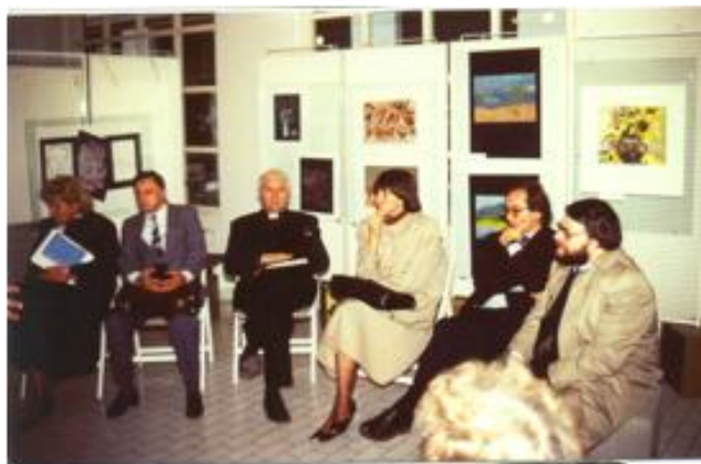
Delegacija Evropskega sveta na obisku, september 1986

Na univerzi za tretje življenjsko obdobje smo prepričani, da marginalizirane družbene skupine potrebujejo ambiciozno izobraževanje, podprto z raziskovanjem, svetovanjem, izobraževanjem mentorjev, javno kampanjo, strokovnimi in znanstvenimi publikacijami ter internacionalizacijo delovanja. Počivati mora na profesionalnih kriterijih in vrednotah. Vsa ta prepričanja smo pričeli uveljavljati leta 1986, ko je univerza postala študijski primer dobre prakse Evropskega sveta in jo je obiskala študijska delegacija te organizacije.