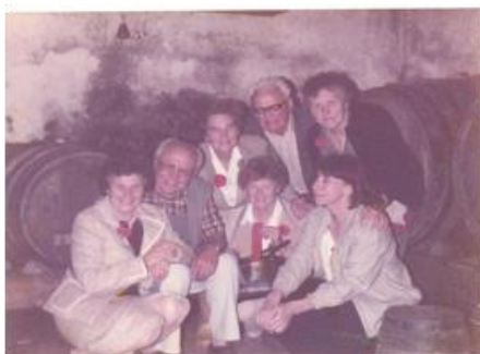
Prvi študenti na študijskem obisku na Dolenjskem, maj 1985

Le enega študenta smo pridobili z oglasom, druge z osebnim stikom. Metoda osebnega povabila in stika je bila živa še nekaj let po ustanovitvi univerze leta 1986. V izobraževanje so otroci vabili svoje starše in njihove prijatelje. Prva leta so se prihajali študenti vpisat v dvojicah: s prijateljem, sosedom, sorodnikom. V dvoje so imeli več poguma.