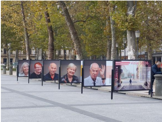
Starejši v središču mesta in pozornosti.