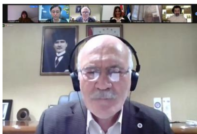
Dekan Univerze v Usaku se zahvaljuje nastopajočim