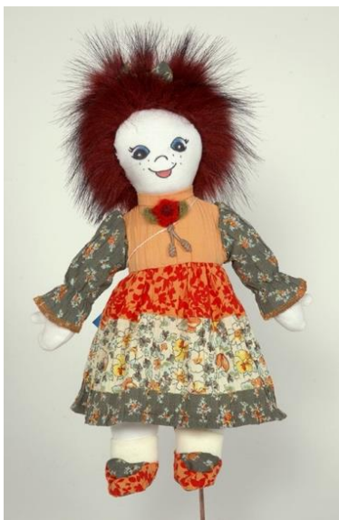
Ena od številnih punčk

V času pandemije so mnogi podhranjeni s poučnimi in relevantnimi vsebinami v povezavi z njimi samimi ali okoljem. Vendar temu ni tako v študijskih krožkih, denimo, angleškega jezika. Prebivalstvene spremembe, zaposlenost žensk, visoka stopnja ločitev in enostarševske družine, vse to spreminja vlogo starih staršev, četudi o tej vlogi ni sledu v družinski politiki in v primeru ločitev staršev stari starši nimajo možnosti proti njihovi volji uveljavljati pravice obiskovanja vnukov, pravice, ki je staršem načeloma zagotovljena. Stari starši, ki pripeljejo ponesrečenega ali bolnega otroka na oddelek urgentne medicine, nimajo pravice zastopati staršev. Pa vendar, časi se spreminjajo! Leta 1836 so vnuki preživeli v poprečju s starimi starši le eno leto, danes preživijo do 28 let. Stari starši so z vnuki v povprečju od 8 do 12 ur na teden. Veliko prispevajo k družinskemu proračunu, saj otrokom kupujejo igrače, plačujejo jim pristočasne dejavnosti, oblačila. Državi prihranijo milijarde (podatek za Veliko Britanijo je sedem milijard). So edini odrasli, ki imajo čas, ki so lahko na razpolago. So varuhi vnukov, tistih, ki bodo nekoč postali polnokrvni državljani in tako so tudi varuhi vseh oblik naše prihodnosti. Stari starši so na pohodu. Nedavno so celo najvidnejšo oddajo francoskega kanala France 2 posvetili starim staršem slavnih ljudi.