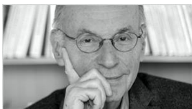
Boris Cyrulnik.

Simone de Beauvoir ne prikazuje starosti običajnih ljudi, marveč misli in občutja v starosti, ki jih imajo pisatelji, pesniki, državniki. Navaja nas na razmišljanje. »Trmasto vztrajanje pri preteklem prekine vez s sedanjostjo,« trdi de Beauvoir, ko piše denimo o sicer izjemno plodnem, delovnem in učinkovitem državniku Clemenceau-ju in prida, da so novi trenutki zgodovine sedanjost in da novi trenutki zahtevajo nove ljudi. Morda res. Spregovori tudi o nekaterih izjemah med ustvarjalci, o glasbenikih, ki včasih svoja najboljša dela napišejo šele v starosti, kajti skozi življenje vse preveč zaupajo tehnikam in si šele v zrelih letih drznejše stopiti na lastno pot. Načne vprašanje starosti v zakonskem paru, pri tem pa navede primer Tolstoja in žene Sonje. Zaključí, da je starost lahko vir neravnovesja v zakonu, tudi med tistimi, ki so bili dotlej videti složni. Starost moramo razumeti, da lahko živimo bolje. Delo priporočamo študentom UTŽO, prav posebej pa izobraževalcem starejših odraslih. Bolje bodo razumeli svoje starejše študente in pomagali jim bodo dobiti vpogled vase.