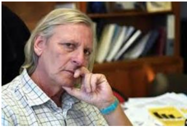
Prof. Didier Raoult

pandemije, ne smemo verjeti, da en vzrok vodi k eni posledici (Descartes), še posebej, če gre za psiho. Nanjo vpliva celota okolja. Socialno okolje in kulturo potrebujemo fiziološko, da se lahko spreminjamo.