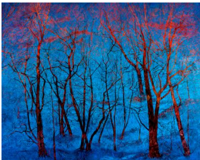
Victoria Crowe, škotska slikarka

Več: http://www.utzo.si/cas-teme-prostor-svetlobe-literarni-zbornik-studijskega-krozka-ustvarjalno-pisanje/