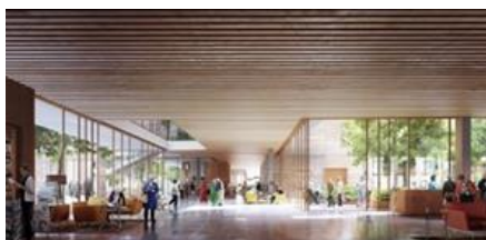
Skupni prostor, ki se odpira navzven in navznoter, podpira dejavno staranje

Odvil se je letni posvet izobraževanja odraslih Andragoškega centra Slovenije. Na spletu se je zbralo domala 400 udeležencev! Spoznanja: formalno izobraževanje s svojimi hipotetičnimi potrebami za prihodnost samo zase ni dovolj; izobraževanje odraslih je ključno - se vidi v krizah! - je način vključevanja odraslih in tudi izobraževalcev odraslih v družbo (mag. Tanja Možina, študija o digitalizaciji izobraževanja odraslih). Posvet je moderirala mag. Zvonka Pangerc Pahernik, pri tem pa poudarila vrednote posveta: humanost, odgovornost, tolerantnost. O odprtem dostopu do izobraževanja, 20-ih modelih obnašanja v digitalnem izobraževanju ipd., je razpravljala mag. Mitja Jermol (UNESCO-v mednarodni raziskovalni center za umetno inteligenco na Institutu Jožef Stefan). Presenetilo nas je razmišljanje, da naj bi se Ministrstvo za izobraževanje odslej posvečalo le izobraževanju za delo, vse drugo naj bi pripadlo področju socialnega varstva? To bi zanikalo izobraževanje vzdolž in širom življenja , temeljno doktrino, ki jo zagovarjamo, prizadelo bi splošno izobraževanje odraslih, kar bi bil usoden korak v preteklost. V krizah se pogosto priznava le tisto običajno, tisto obče, tisto vsem razumljivo, inovativne oblike in rešitve so ogrožene. Toda, ko kriza mine, bomo takrat ostali brez inovativnih rešitev? Ranljivo je tudi izobraževanje starejših, ki povezuje učenje z delovanjem v dobro skupnosti in krepitev identitete starejših v družbi.