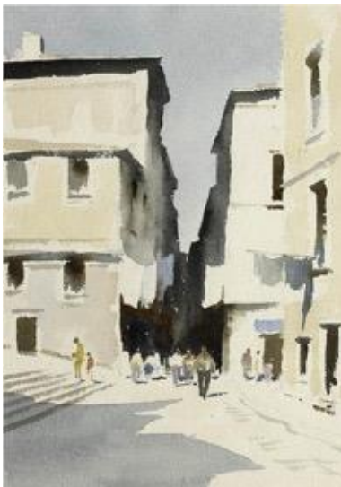
Vir: Edward Seago, 1974. Ulica v Alfami.

Več: http://www.learnersmot.eu/online-course-start.php