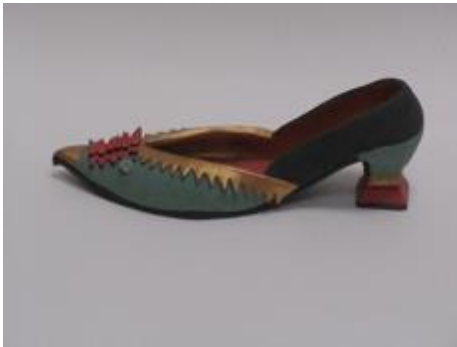
Še Pepelka bi ga z veseljem obula