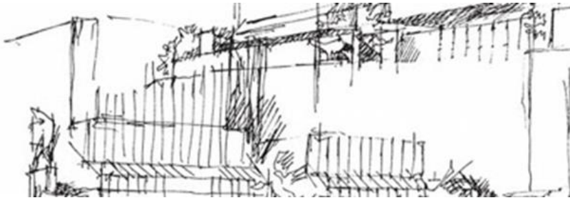
»Comeback« študijske skupine Trgi, ulice in stavbe okoli nas