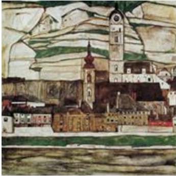
Egon Schiele: Stein na Donavi.