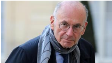
Boris Cyrulnik.

Urbančič, M. in drugi: »Ekspanzivno učenje in raziskovalne prakse na Slovenski univerzi za tretje življenjsko obdobje« v: Andragoška spoznanja : https://doi.org/10.4312/as.26.1.97-114