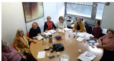
Skupinski potret z mentorico