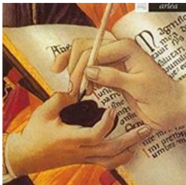
Steiner: Le silence du livre