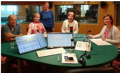
V studiu prvega programa Radia Slovenija.