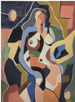
Avtor: Mihael Koželj

Akt , razstava likovne študijske skupine UTŽO Ljubljana, mentorica akad. slikarka Duša Jesih