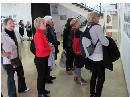
Trden most prijateljstva med Ljubljano in Zagrebom