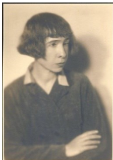
Alma Karlin