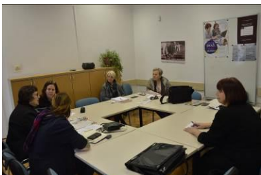
Okrogla miza z mentorji