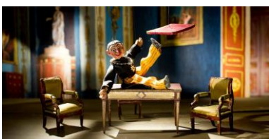
Muzej lutkarstva na Ljubljanskem gradu