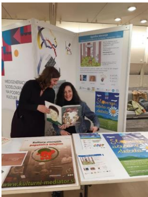
Dve Urški in stojnica SUTŽO na Kulturnem bazarju