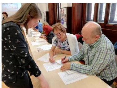
Predstavitveno srečanje z mentorico

Več: https://www.refugeesinproject.eu/en/pack/catalogue/films.html