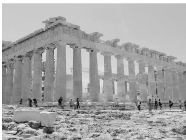
Akropola.