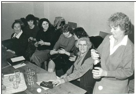
Obred v skupini Novinarji. Leto 1986