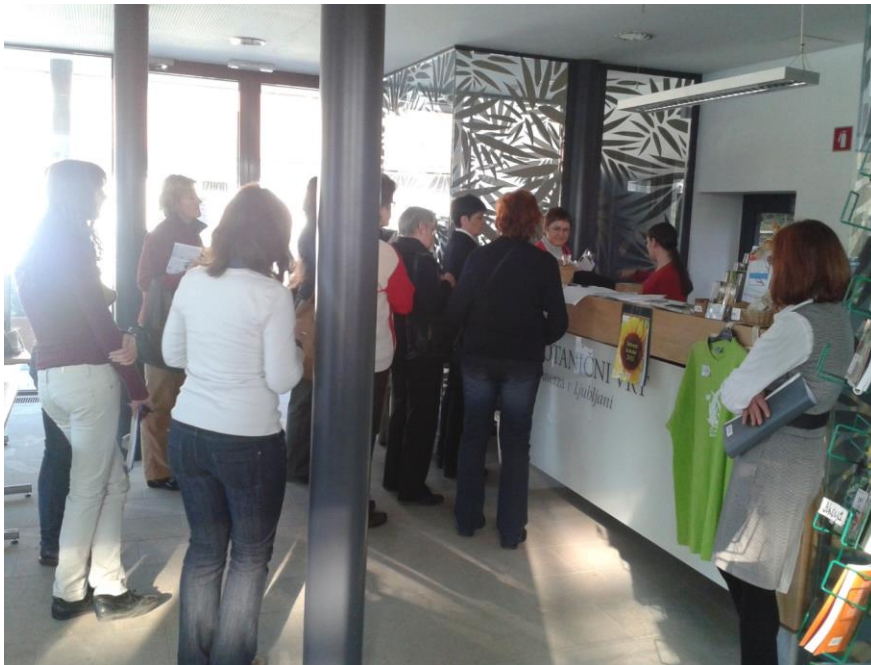
Receptor v steklenjaku mora vedeti marsikaj.

V okviru projekta avtorice načrtujejo krepitev povezovanja med prostovoljci z organizacijo skupnega učenja in krepitevijo samostojnega učenja. Prostovoljci bodo postali ambasadorki za posamezne rastline, kar vključuje podrobno poznavanje izbranih rastlin. Načrtujejo tudi razvoj programa, ki bi se še bolj približal potrebam vključenih (mentorjev, zaposlenih v Botaničnem vrtu) in potrebam obiskovalcev Botaničnega vrta. Poleg tega načrtujejo tudi obsežnejšo javno kampanjo za ozaveščanje prebivalcev Slovenije o različnih vlogah starejših, ki jih lahko imajo pri trajnostnem razvoju. Prepričani smo, da imajo starejši ljudje pomembno vlogo pri aktivnem spreminjanju družbe in ta vloga ni le vloga starih staršev. To je razvidno tudi iz priloženega kratkega poročila, ki slika začetke delovanja kulturnih mediatorjev, vrtnih prostovoljcev pri nas.